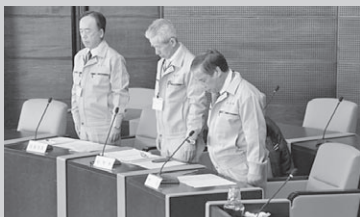
▲東日本大震災の犠牲者に黙とうをささげる（議会本会議にて）