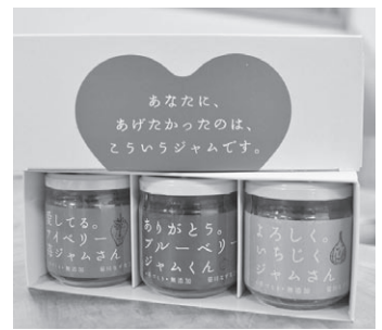
▲大賞を受賞したジャム3種（苺・ブルーベリー・イチジク）ギフトセット