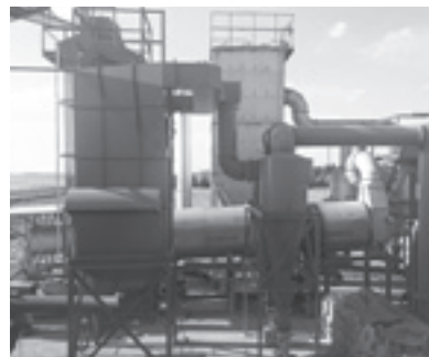
▲デザインした砂の選別機

息子は、頑張つてよくやつ ていますね。いつもの確に指 示をくれるので、助かりま す。製作は一人で行いますが、 仕事は決して一人ではなく、 チームワークが大切です。み んなで仲良くやっています。