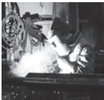
▲鉄に熱を加え溶接する

鉄工所で製作しているの は、主に砂や砂利、肥料、飼 料などの運搬、選別する機械 です。発注を受け、製作、加 工、塗装、取り付けまで行っ ています。金属会社や飼料会 社などお客さまから要望を受 けたオリジナルの製作物のた め、喜んでもらえることやりが い感じますね。お客さまに 困ったことなどがあつたら、 すぐに対応します。柔軟で迅 速な対応を心がけています。 仕事を始めたころ、父が病 気になり、祖父にたくさん のことを教えてもらいました。 祖父も病気のため一緒に仕事 をできたのは1年だけでした が、とても貴重な時間でした。 頼れる存在の人がいなくなっ