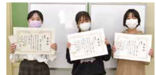
小学校金賞▶受賞者

町青少年相談員連絡協議会と町図書館が共催したPOPコンテストの表彰式が中学校、小学校で行われました。「私が紹介するとびきりの1冊」をテーマに応募総数は、323作品となりました。作品は、町図書館に掲示されます。ぜひご覧ください。