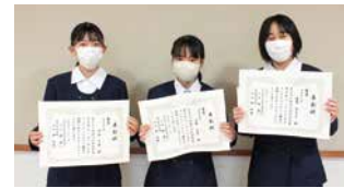
◀中学校金賞受賞者