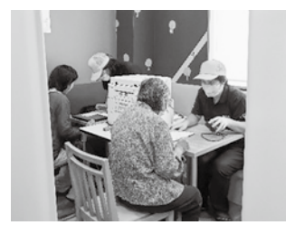
▲スーパーでの出張サポートの様子