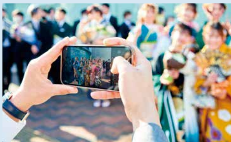
▲ハイチーズ

成人式改め二十歳の門出、とても素敵な式典でした。ついつい慣れずに「ご成人」と口に出してしまいましたが、20歳を迎えた皆さまをおめでとございます。式典終わり、たくさん笑顔撮影させていただきました。また「20歳のことば」で一部の方にインタビューをさせていただきましたが、皆さま希望あふれる将来に向け楽しく過ごしているようでした。わたしも元気な皆さんを見ることで、明るい未来になるよう日々努力をしようと決心しました。（さ）