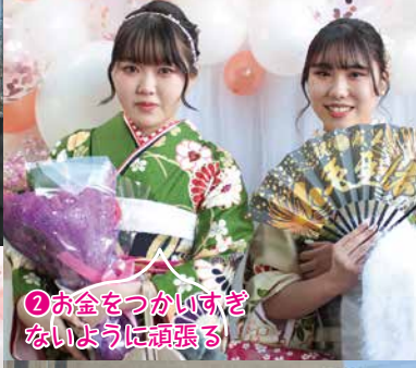
②お金をつかいすぎないように頑張る