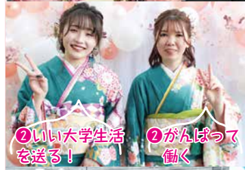
②いい大学生活を送る!