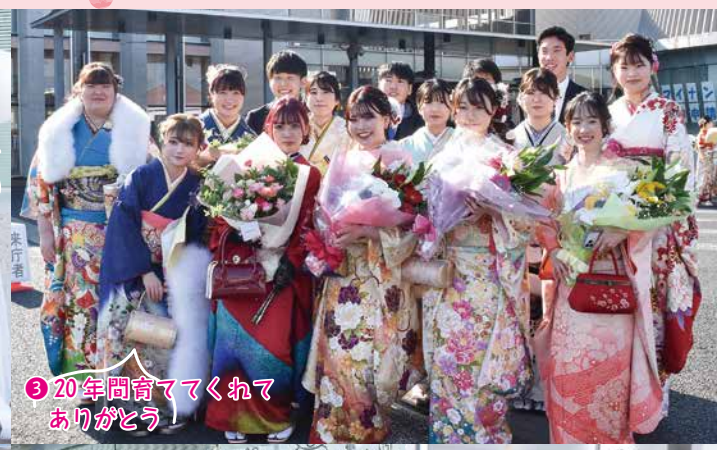
③20年間育ててくれてありがとう