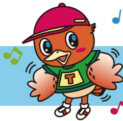
東庄町イメージキャラクター コジュリンくん