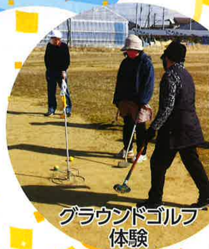
グラウンドゴルフ 体験