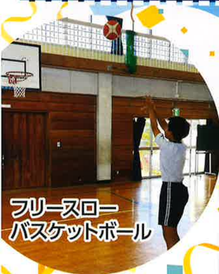
フリースロー バスケットボール