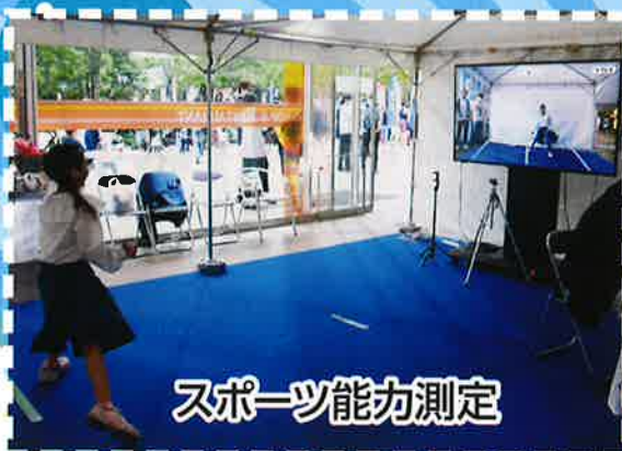
スポーツ能力測定