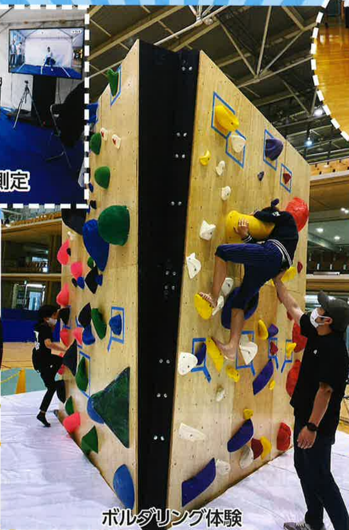
ボルダリング体験