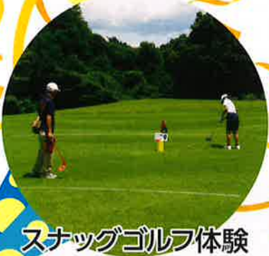
スナッグゴルフ体験