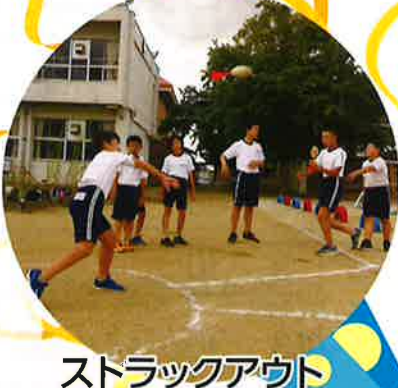
ストラックアウト