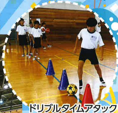
ドリブルタイムアタック