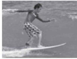
休日はサーフィンも楽しんでます

皆さんこんにちは。東庄に赴任して早くも1年が経ちました。妻とともに東庄のいちごに魅了され、今季だけで10箱以上食べたかと思えます。さて、今日はみなさんにばね指について話します。ばね指は聞いた事がない方も多いかもしれません。ばね指とは、指を曲げるときに使う屈筋腱の上を覆っている腱鞘に炎症がおきて、指の付け根が痛くなったり、指を伸ばす時にカクンと伸びたりする病気です。掌には手の指を曲げる屈筋腱というヒモのようなものがあり、このヒモが指を引っ張ることで指が曲がります。この屈筋腱は掌で指の付け根の部分にある腱鞘というトンネルの中を滑走しています。ここで、指の使いすぎ等で屈筋腱と腱鞘