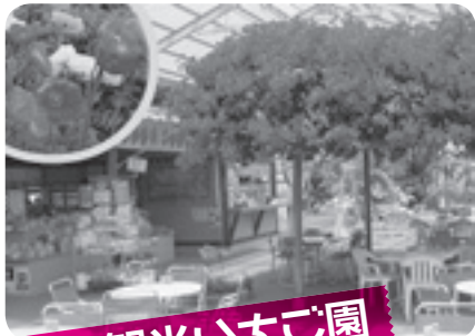
磯山観光いちご園