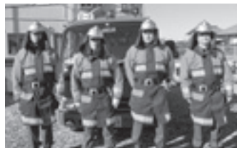
▲防火衣が交付された第2分団第2部

石油貯蔵施設立地対策事業交付金を利用して購入した、小型ポンプおよび防火衣の交付式が、1月14日(日)に行われました。小型ポンプは3部、防火衣は8部へ更新配備され、消火活動の強化を図ります。