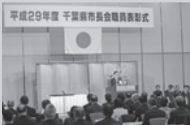
▲千葉県町村会を代表しあいさつ