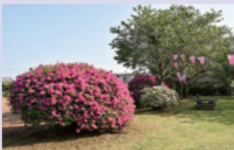
▲雲井岬つつじ公園 (4/20)

イベントの開催は、つつじの開花に合わせて関係者の皆さんが事前に準備を進めていくわけですが、やはり屋外で開催されるイベントは天候に左右されます。来年は、満開のつつじとともにイベントが開催されることを願うばかりです。 (M)