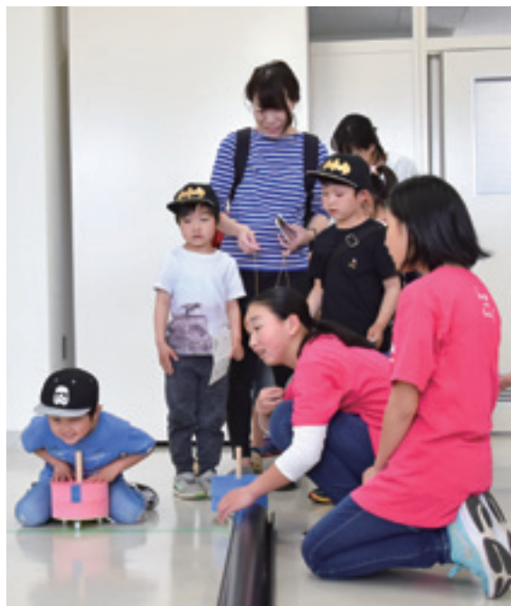
▲子どもまつりでの活動の様子

楽しい行事がたくさんあり、キャンプやクリスマス会もみんなで協力して行います。中学生から大学生までのかけがえのない仲間と一緒に、子どもと大人の架け橋・ジュニアリーダーとして活動してみませんか。興味がある方は、お気軽にご連絡ください。