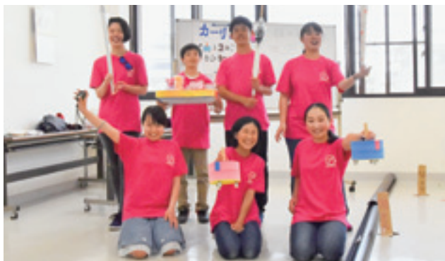
▲新会員募集中！待ってます!!