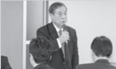
▲特命委員会にて全国町村会を代表し東庄町の現状を説明