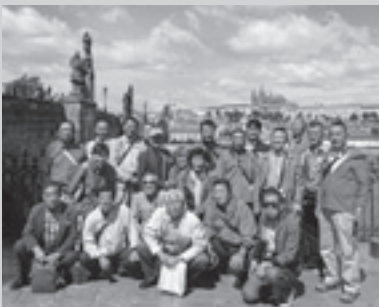
▲チェコのプラハにて