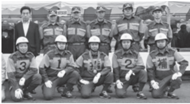
▲町消防団第3分団第2部の皆さんと岩瀬新宿区長

法大会の香取支部大会が、栗源消防訓練場で開催されました。小型ポンプの部に出場した町消防団第3分団第2部(新宿区)は、出場団体の中で1番速いタイムを記録しましたが、4位と惜しくも入賞