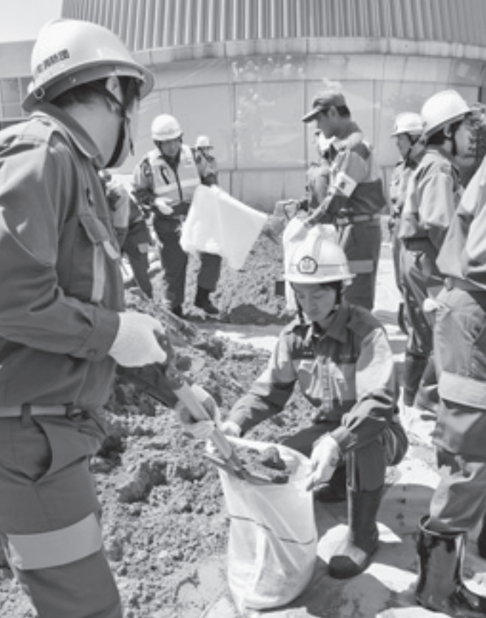
▲町防災演習では、風水害に備え土のうを作り、土のう積み工法も学んでいます。