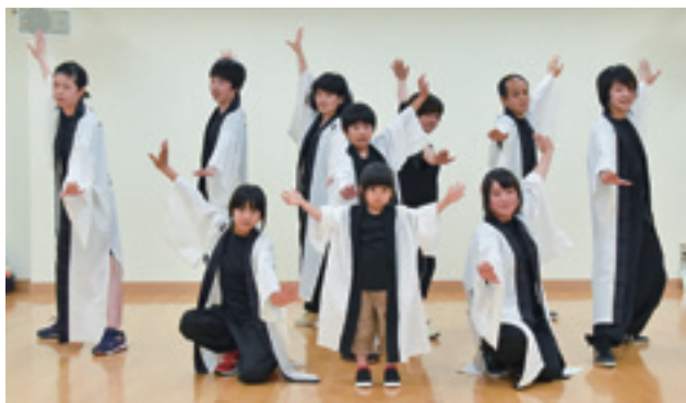
▲よさこい好き集まれ! 公民館での練習見学もできます!