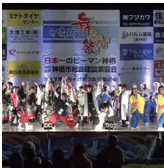
▲全国のよさこい好きと仲良くなり情報交換しています (昨年のかみす舞っちゃげ祭り)

に引っ張りだこ。かみす舞っちゃげ祭りや七夕まつりなど夏は多くのイベントに出演しますので、興味がある方はぜひご覧いただき、お気軽にご連絡ください。