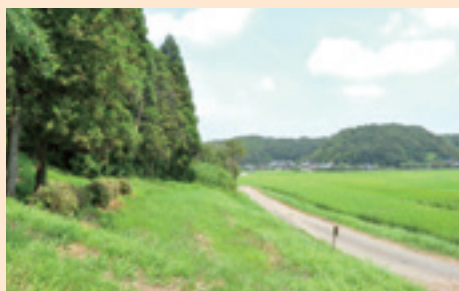
▲夜にはホタルの舞う景色にへ～んしん!