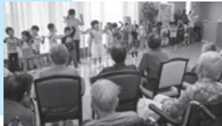
施設訪問による交流も行っています

専任講師によるプログラムも豊富にあり、ラテンパーカッションやリトミック、英語遊び、運動遊びなど、楽しみながら子どもたちの豊かな心を育てます。