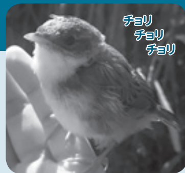
スズメ目センニュウ科センニュウ属

東庄町の皆さんなら、チョリチョリ リチョリとさえずりながら上空へ飛 び出し、大きく逆U字に飛んでヨシ 原に戻っていく、ダイナミックな姿 をご覧になったことがあるかもしれ ません。彼の名前はオオセッカ。コ ジュリンと同じくヨシ原に暮らす小 鳥です。この「さえずり飛翔」と呼 ばれる求愛や縄張り誇示のための行 動は、子育て期特有のもので、大規 模に見られるのは、青森県の2カ所 と利根川下流域の日本中でたった3 カ所のみ。オオセッカも絶滅危惧IB 類の希少な鳥です。 オオセッカは、コジュリンより地 面が湿った所に巣を作ります。堤防 上からは同じように見えるヨシ原 も、中に入ってみるとヨシの高さや 下草の有無等さまざまに変化があ り、鳥たちはそれぞれ自分の好む場 所に住んでいます。しかし、放置し ていると、ヨシ原の中身はどんどん 同じようになり、暮らせる生き物の 種類は少なくなってしまう。こ のようなとき、オオセッカはいち早 く住む場所をなくしてしまう鳥で す。昔は大水やヨシの利用等で自然 に保たれていたヨシ原の多様性も、 現在は人間が意識して管理する必要 があります。自然を守ろうとするこ と、そっとしておくだけでは守れな いこともあるのです。