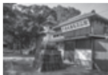
天保水滸伝遺品館