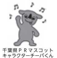
千葉県PRマスコットキャラクターチーバくん

千葉労働局では、中小企業・小規模事業者等を中心に働き方改革に取り組む事業主の皆さまにアドバイスを行う「千葉働き方改革推進支援センター」を設置しました。ご都合に合わせて、来所、メール、電話、個別訪問などの相談方法が選べます。ぜひご活用ください。