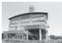
利根川河口堰管理所