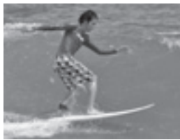
休日はサーフィンも楽しんでます

皆さんこんにちは。東庄に赴任して早くも1年が経ちました。妻とともに東庄のいちごに魅了され、今季だけで10箱以上食べたかと思えます。さて、今日はみなさんにばね指について話します。ばね指は聞いた事がない方も多いかもしれません。ばね指とは、指を曲げるときに使う屈筋腱の上を覆っている腱鞘に炎症がおきて、指の付け根が痛くなったり、指を伸ばす時にカクンと伸びたりする病気です。掌には手の指を曲げる屈筋腱というヒモのようなものがあり、このヒモが指を引っ張ることで指が曲がります。この屈筋腱は掌で指の付け根の部分にある腱鞘というトンネルの中を滑走しています。ここで、指の使いすぎ等で屈筋腱と腱鞘