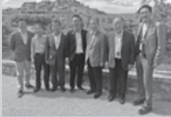
▲ルシヨン村で7人の町村長と