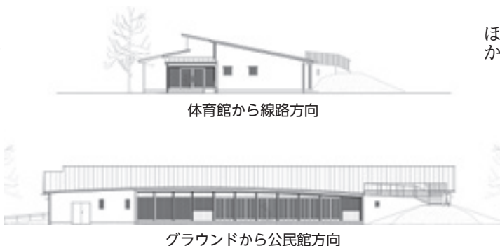
体育館から線路方向