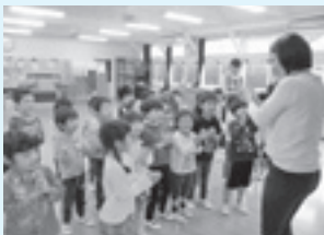
エイヨット先生の英語であそぼう

先日は、桜井町公園へ行き、いろんな遊具に挑戦してきました。また、ふれあいセンターにも行き、こじゅりんルームの小さなお友だちと「おいしいおもいになあれ!」と言いながらさつまいもの苗を植えました。お芋掘りがとても楽しみです。