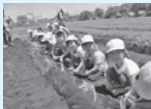
おいしいおもいになあれ!