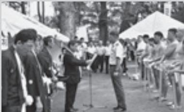
▲奉納相撲にて感謝状贈呈