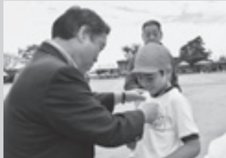
▲一等賞おめでとう（橘小）