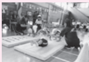
▲チャンス走での前転