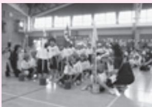
▲かけっこ頑張ったよ!

この運動会を通して、体力的な成長だけでなく、しっかり話を聞いて行動する大切さ、最後まで頑張る気持ち、友だちとの協力(協調性)などの内面も著しく成長しました。