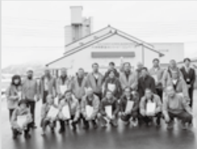
▲JA魚沼みなみ特産センターにて