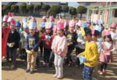
▲福の神の登場に一安心