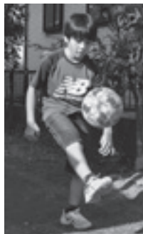
▲おうちの庭で リフティング