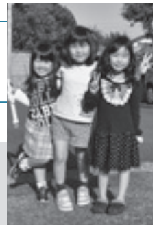
▲お母さんとおうち 近くを散歩中

勉強やお片付けを頑張っ ています。いとこも隣に住 んでいるので、みんなで遊 んだり散歩に出かけたりも しています。(お母さん談)