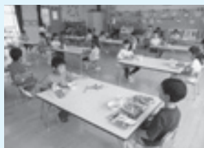
チームに分かれて給食