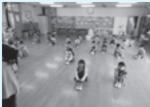
間隔を開けて朝の会