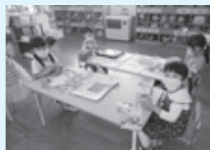
お友だちと室内遊び