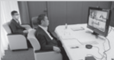
▲千葉県自治會館からテレビ會議に参加