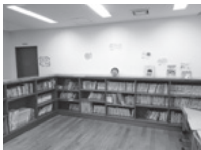
図書室再開！ 遊びに来てね