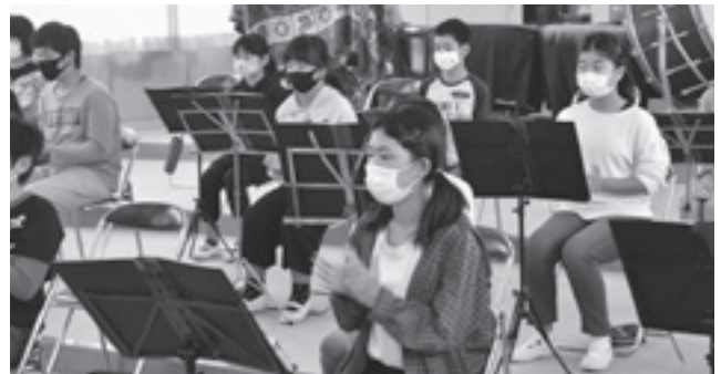
▲リズムをとる練習（音楽部）