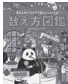
(日本図書センター)