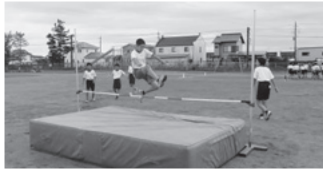
▲高跳びの練習（運動部）