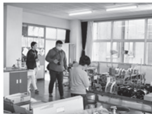
▲実験で使った理科室の備品 (橘小)