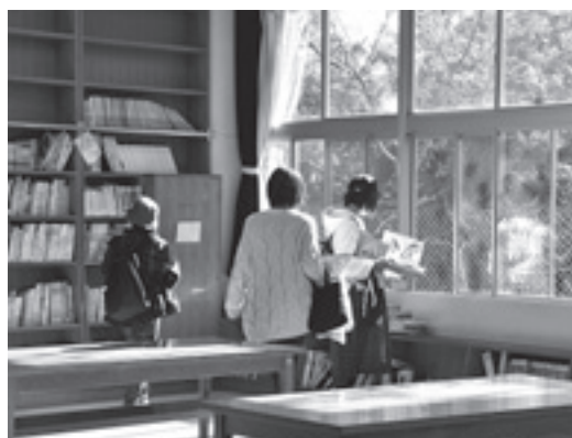
▲図書室にはたくさんの児童図書 (東城小)