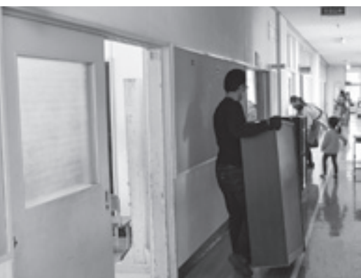
▲思い出の品も家庭で再利用 (神代小)