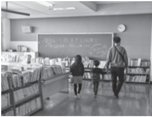
▲子どものころは大きく感じた教室（石出小）