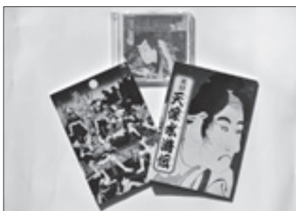
東庄町観光ガイドの会 実録天保水滸伝・余禄天保水滸伝、 天保水滸伝語りDVD など