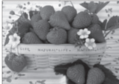
東庄町観光いちご組合 アイベリー