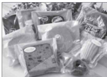
布施菓子店 自家製菓子詰め合わせ (和菓子、洋菓子) など