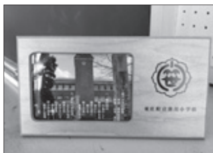
山本まさみ 笹川小学校閉校記念 オルゴール