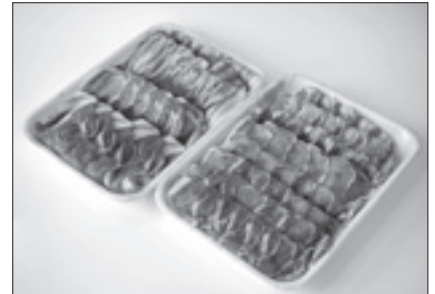
肉のハヤシ 特選あやめポーク 詰め合わせ など