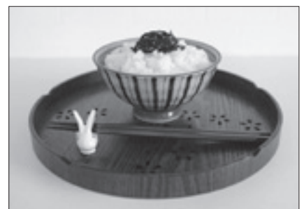
侘山中米穀 【お米マイスター厳選】 東庄町産コシヒカリ