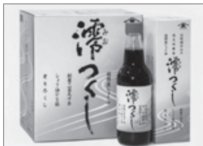
入正醤油(株) 溜つくし