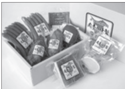
田谷ミートセンター(株) 東庄町産SPF豚肉 加工品セット など