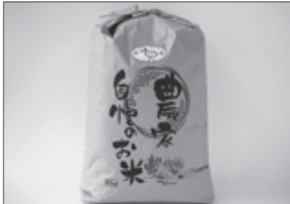
農事組合法人 新宿宮農組合 東庄産エココシヒカリ

全国に贈られている返礼品。中には地元の方でも知らない商品があるかもしれません。 皆さんも一度手に取ってみてください。