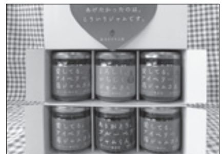
社会福祉法人さざんか会 笹川なずな工房 ジャムギフトBOX (アイベリーいちご 無添加)