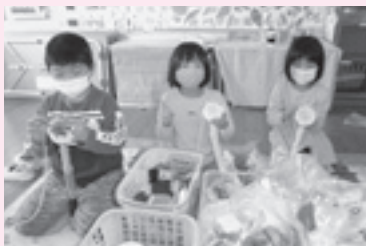
▲手作りマフラー楽しみ!