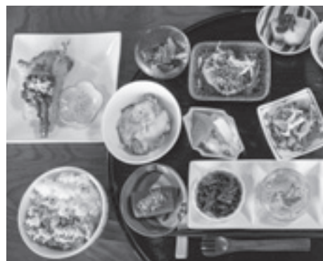
▲自慢のお米とたくさんの野菜を使ったメニュー

—商品への想いを聞かせてください。 私は生まれも嫁ぎ先も米農家で、以前は農薬を使わずにお米を作るなんて考えたこともありませんでした。しかし、10年前に農薬を一切使わない玄米を食べて衝撃を受けました。同時に、農薬を使って育てたお米を自分の子どもに食べさせていたことに怖くなったんです。愛する人の健康を守るため、自分にできることは何だろうと考えたときに、農薬や肥料を使わずにお米を作ろうと決めました。それから3年間、農薬・肥料不使用でお米を育てる方法を学び、自分の田んぼでもそれを始めました。