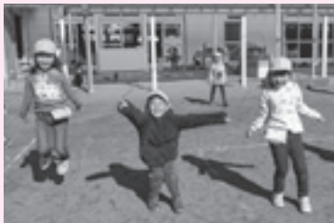
▲縄跳びたくさん跳ぶぞ!