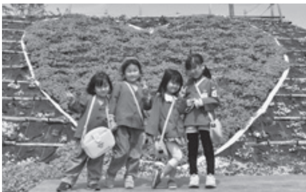
▲ハートのシバザクラの前でポーズ

芝桜の会の方は、「去年12月にとても寒くなって、そのあとに一回暖かくなったおかげで、今年はきれいに咲きました。来年も咲かせるつもりです」と笑顔で語っていました。