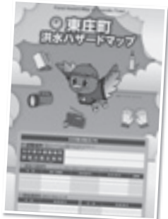
洪水ハザードマップ

地震と比べて予め予測ができ、事前の避難ができるのが風水害や土砂災害です。事前に洪水ハザードマップで浸水想定域や土砂災害（特別）警戒区域等を確認しましょう。 河川に近い笹川地区や橘地区の一部では、3mを超える浸水が想定されています。