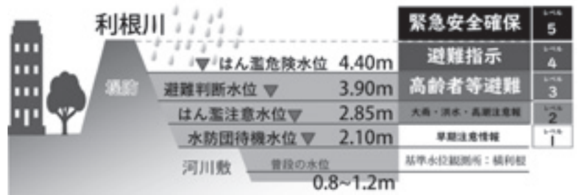
河川水位は利根川下流河川事務所のホームページから確認できます

高齢者だけでなく障害のある人や移動に時間がかかる人は、避難を始めます。高齢者等以外の人は、必要に応じ、普段の行動を見合わせ、避難の準備をしましょう。危険を感じたら、自主的に避難をしましょう。