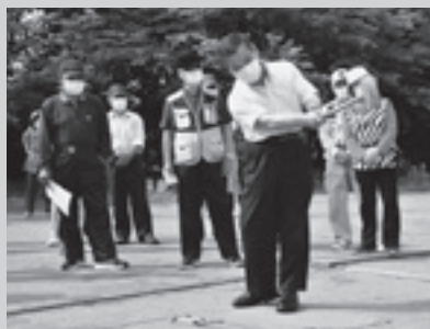
▲グランドゴルフ大会 始球式