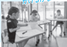
なんこ かけるかな