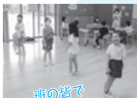
班の皆で がんばるぞ!