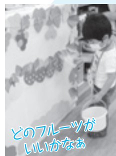
どのフルーツが いいかなあ