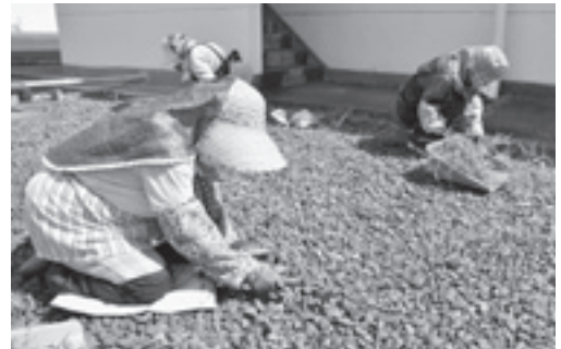
▲手際よく除草作業

シルバーの仕事は、健康的に楽しくできるのが良いですね。家の中にいるだけでは、体もなまってしまうので、自分の健康のために働けると思うと本当に幸せです。また、仲間と世間話をする事で、社会と繋がれるのも魅力です。仕事は、主に除草作業や和裁、洋裁などをします。コロナの影響でなかなか外出できなくなりましたが、シルバーの仕事があつて本当に良かったです。