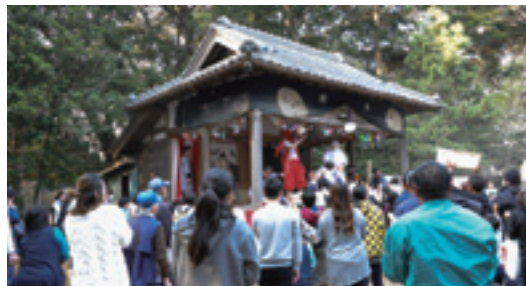
◀神楽の様子(二〇一九年)

左右大神の本殿に行くには、勾配の厳しい坂道を登っていきます。帰りは逆に厳しい下り坂になりますので、参拝の時は足元に注意して、ケガをしないように気を付けてくださいね。