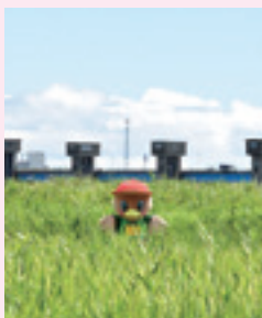
▲利根川河川敷でかくれんぼ