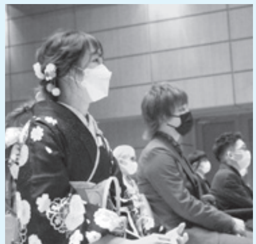
▲5月に行われた成人式の様子