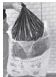
▲この状態でのゴミ出しはお止めください

ごみ袋を二重（黒色の袋や肥料袋などの袋類に入れてから指定袋に入れる）にし、中身が見えない状態で出されるケースがあります。 二重袋での排出は、外側から中身の確認が難しく、分別されていないごみが混在していると、収集時の事故や焼却場で機械の故障などの原因につながります。設備の故障修理には多くの時間や費用がかかることとなりますので、