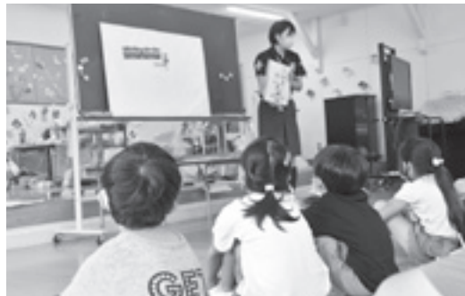
▲こじゅりんこども園での様子

町では、町内こども園、保育園3園の園児を対象に幼児交通安全教室を年6回実施しています。