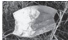
▲ポイ捨てされたマスク

町内で、マスクのポイ捨てが目立ちます。使用済みのマスクは、回収者への感染リスクがあります。また、不織布マスクは、合成繊維で作られていて、自然環境にも悪影響を及ぼします。ポイ捨ては、絶対にやめましょう。