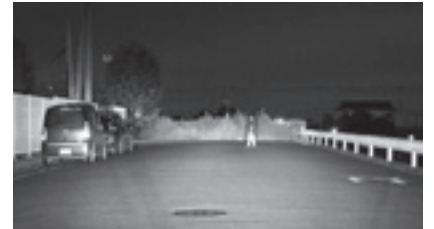
▲ハイビームでの見え方