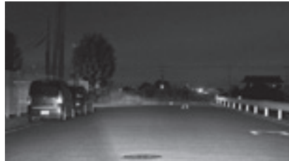
▲ロービームでの見え方

運転者は、前照灯（ハイビーム等）を有効活用して、歩行者や自転車の早期発見に努め、歩行者や自転車も反射材を着用するなどして、お互いに交通事故防止を心がけましょう。ハイビームは他の車両を眩惑させるおそれがあるので、前走車・対向車がいる場合は、ロービームへ小まめに切替えてください。