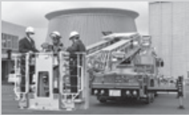
▲災害対応特殊はしご付消防ポンプ自動車に試乗する町長と副町長