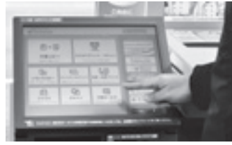
▲マルチコピー機を操作

全国のコンビニエンスストアで住民票の写しや 印鑑登録証明書などが発行できるようになりました。 ぜひご利用ください。