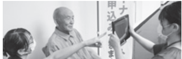
▲お子さんからご高齢の方までお手伝いします

※申請時に本人確認書類の提示がない方、暗証番号の設定依頼をしない方は、受け取りのため再度役場へ来ていただきます。