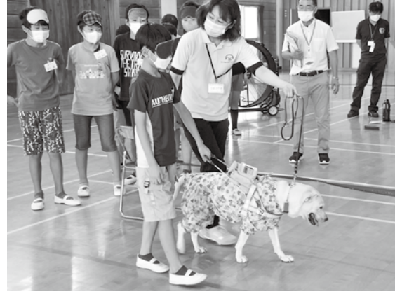
▲アイマスクを付けて盲導犬と歩行体験