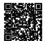
▲国税庁ホームページ