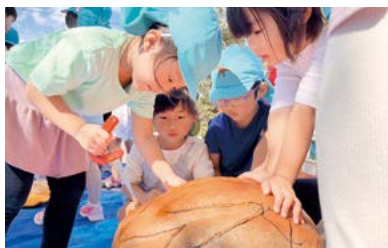
▲笹川中央保育園でのランタン作り