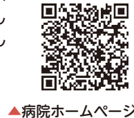
▲病院ホームページ