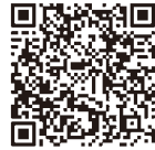
▲訪問看護ホームページ

看護師がご自宅に訪問し在宅療養をサポートします。かかりつけ医の指示を受け病院と同じような医療処置も行います。