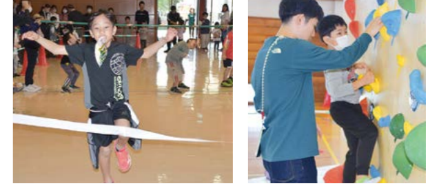
▲パン食い競争 ▲ボルダリング体験

町公民館、町民体育館、小学校体育館及びグラウンドでスポーツフェスタが開催されました。AIによるスポーツ能力測定のほか、ボルダリングや競技用車いす体験コーナー等が各地に設けられ、沢山の参加者で盛り上がりました。