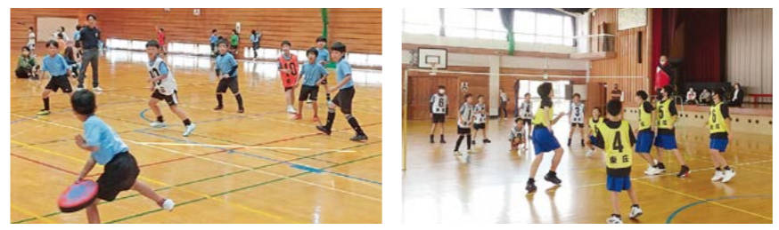
▲ドッジビー ▲ヘルスパレーボール

町民体育館と小学校体育館で行われた子どもスポーツ大会では、東庄小学校の児童83人の参加がありました。種目は、1～3年生はドッジビー、4～6年生はヘルスパレーボールを行い、チームを組んで競いました。