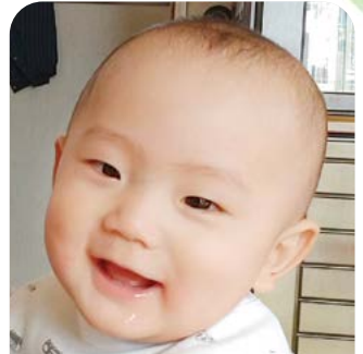
ばい か あい 梅花 碧 くん 竜神台