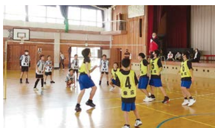
▲ヘルスバレーボール

町民体育館と小学校体育館で行われた子どもスポーツ大会では、東庄小学校の児童83人の参加がありました。種目は、1～3年生はドッジビー、4～6年生はヘルスバレーボールを行い、チームを組んで競いました。