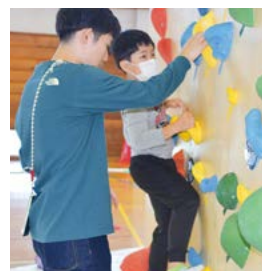
▲ボルダリング体験