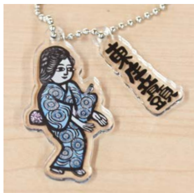
▲役場庁舎内にあるデザインも…!? (H)

紙面でも紹介させていただきましたが、「街ガチャ」N東庄の販売が始まりました。「思わずクスッとくる東庄町あるある」というテーマで、役場の若手職員によるデザイン会議を重ねました。見て楽しい、回して楽しい街ガチャをぜひご購入ください。