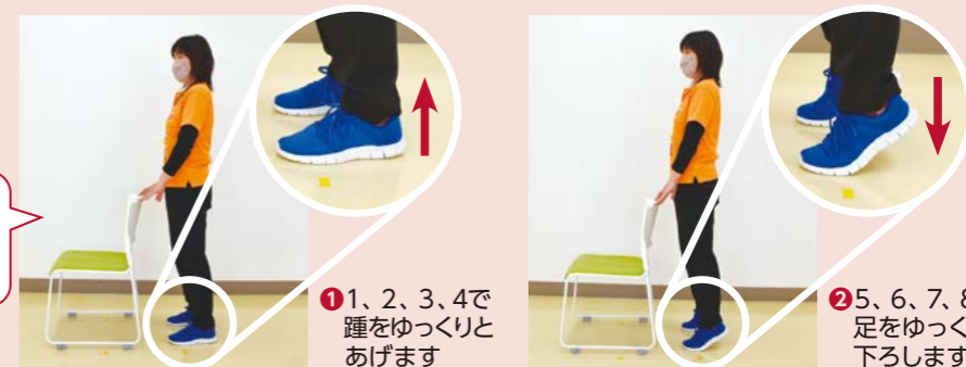
お手本/こじゅりん体操サポート