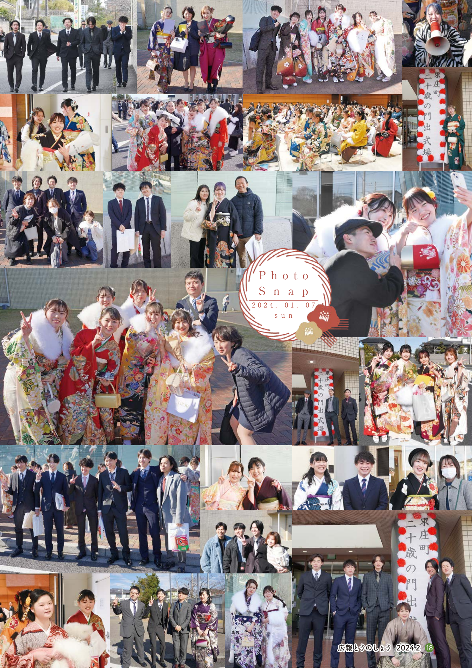
Photo Snap 2024. 01. 07 sun