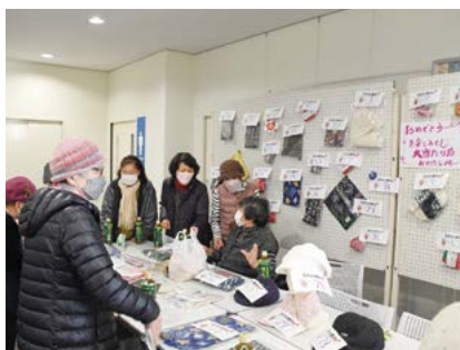
▲お楽しみくじブース