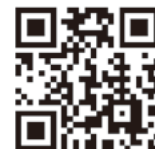
▲確定申告書等作成コーナー