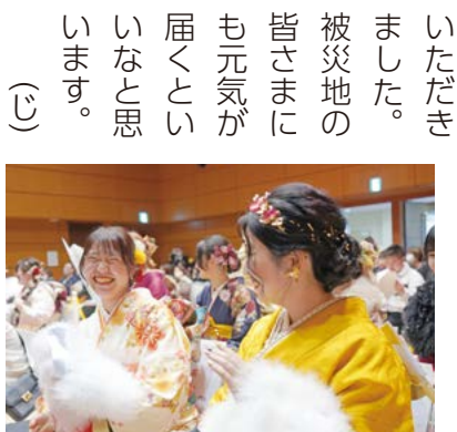
▲二十歳の門出の様子

二十歳を迎えた皆さまおめでとうございます。今年には暗い出来事からスタートしました。そのような中、二十歳の門出が開催でき、喜ばしく思います。