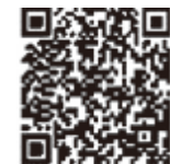
▲国税庁LINE公式アカウント