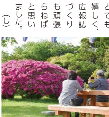
▲旭市から来ていた素敵なお夫婦

5月上旬、雲井つづじ公園に取材に行きました。幼少期に家族で見に行っていたようなのですが、気が付けば場所も少し迷ってしまったり、遠い記憶になっていました。見に来ていた方々に取材をすると、町外の方がほとんどでした。離れた場所からも町のつづじを見に来ていただけるとも嬉しく、広報誌づくりも張りばらねばと思いましたが、旭市から来ていた素敵なお夫婦