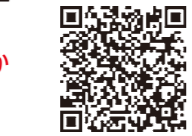
▲病院ホームページ