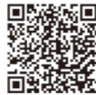
▲訪問看護 ホームページ

看護師がご自宅に訪問し在宅療養をサポートします。かかりつけ医の指示を受け病院と同じような医療処置も行います。